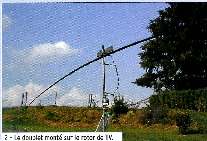
2 - Le doublet monté sur le rotor de TV.

Bien entendu, lorsque l'on n'est pas dans le cas du classique dipôle, c'est-à-dire dans le cas d'une antenne plus courte ou plus longue, l'impédance de l'antenne n'est plus l'habituel "73 ohms", ce qui pose des problèmes pour l'alimentation de nos chers TX, classiquement conçus pour une impédance de sortie de 50 ohms. Il est cependant possible